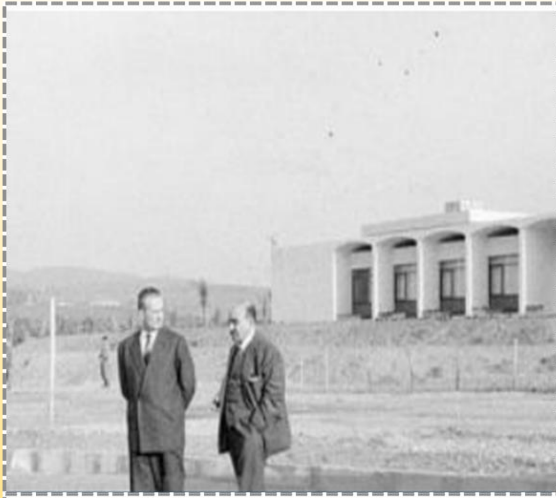
صورة نادرة لمبنى مقر الهيئة التنفيذية للحكومة الجزائرية المؤقتة يوم 30 مارس 1962، على يمين الصورة عبد الرحمن فارس، وبجواره برنار تريكوت